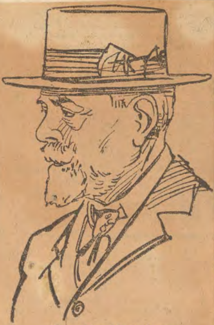
Ὁ κ. Σπ. Μερκούρης

Λαμβάνω τὴν τιμὴν ὅθεν νὰ σᾶς ζητήσω ὅπως λάβετε τὰ κατὰλληλα μέτρα ἵνα ἐγκαταλείψετε τὸ Ἑλληνικὸν ἕδαφος