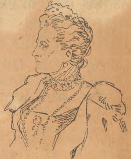
Ἡ Α.Μ. ἡ Βασίλισσα Σοφία

Γιαννουλάτου ἐξεβλήθον ἐκ Πειραιῶς προσέχρυσεν εἰς τορπίλιν καὶ μόλις εὗρε τὸν καιρὸν νὰ ριφθῇ ἐπὶ τῆς νη-