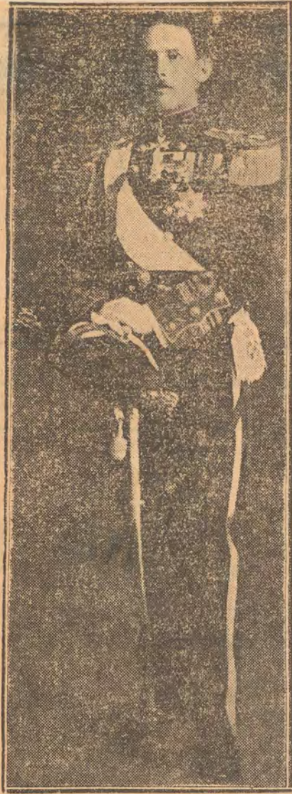
Βασιλεὺς Γεωργίος Ι.

τῆς Α. Μ. τοῦ Βασιλέως Κωνσταντίνου παραβιάσαντος προφανῶς ἐξ ἰδίας πρωτοβουλίας τὸ Σύνταγμα, τοῦ ὁποίου ἡ Γαλλία, ἡ Μεγάλη Βρετανία καὶ ἡ Ρωσσία εἶνε ἐγγυήτρια, ἔχω τὴν τιμὴν νὰ δηλώσω εἰς τὴν ἑπισημὴν Ἐξοχότητα ὅτι ὁ Βασιλεὺς ἀπέπεσε τὴν ἐπισημὴν τῶν Προστατῶν Δυνάμεων καὶ ὅτι αὐταὶ θεωροῦν ἐαυτὰς ὡς ἐλευθερὰς ἀπέναντι αὐτοῦ τῶν ὑποχρεώσεων αἱ ὁποῖαι ἀπορρέουσι ἀπὸ τὰ ἐαυτῶν δικαιώματα προστασίας.