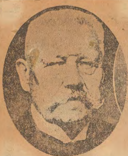
Χίνδεμπεουργκ, νυν Πρόεδρος της γερμανικής Δημοκρατίας