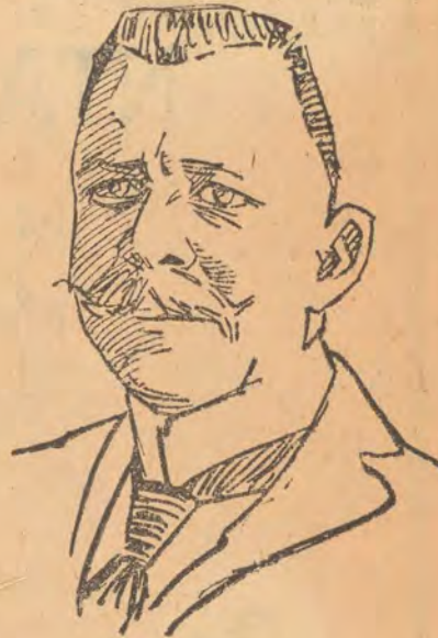
Ὁ κ. Στρεϊτ

Στέμματος προσωρινῶς καὶ ἄς ἔλθωμεν εἰς τὸν Ζεννάρ.