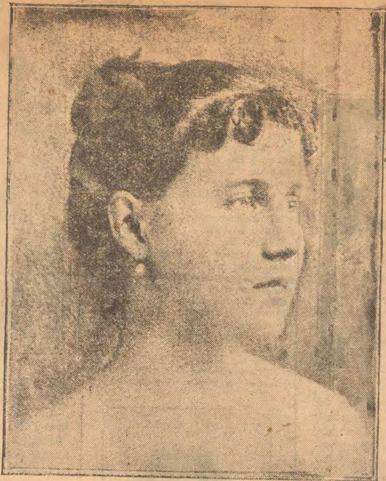
Η ΒΑΣΙΛΟΠΟΥΛΑ ΑΛΕΞΑΝΔΡΑ

Τὸ συμπαθητικώτερον τέκνον τοῦ Βασιλέως Γεωργίου Α' τῆς Ἑλλάδος ὑπῆρξεν ἡ πριγκίπισσα Ἀλεξάνδρα. Αὕτη μόνον τὴν ἀγάπην τοῦ λαοῦ προσείλκυεν. Ἡ βραγεία ζωὴ τῆς ἐπέρασε σάν ὄνειρο καὶ, ὅπως ἡ ζωὴ συνήθως τῶν ἀνθρώπων, μετὰ καὶ εὐτυχίαν κατ' ἀρχάς, μετὰ πόνους καὶ δάκρυα εἰς τὸ τέλος. Ἐγεννήθη εἰς τὴν Κέρκυραν εἰς τὸ ἀνοσπερὲς ἀγροικίον Mon Repos, τὴν 18 Ἀυγούστου 1870.