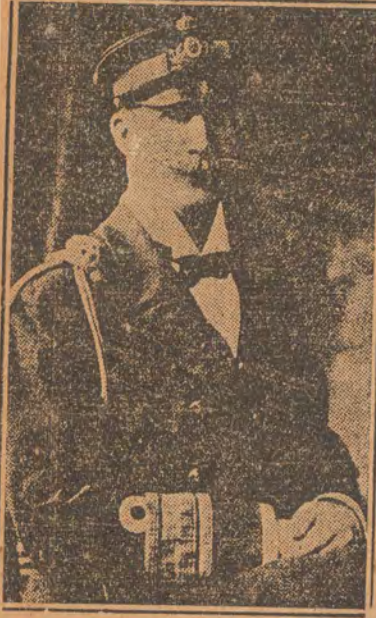
Ὁ πριγκιπὴ Γεώργιος, ὁ ὁποῖος ἐνεργεῖταις τοῦ Βασιλέως ἐστάλη ὡς ἀρμολογιστὴς ἐν Κρήτη.

τελειογραφικῶς τὴν λήψιν ἀμέσων μέτρων πρὸς διάρθρωσιν τῆς οικονομικῆς καταστάσεως καὶ διὰ τοῦ ὁποῖου ἐδηλώθη εἰς τὴν Κυβέρονσιν, ὅτι ὁ λαὸς, ἐάν δὲν ἐλαμβάνοντο τὰ μέτρα αὐτά, θὰ ἤρνοιτο νὰ καταβάλλῃ εἰς τὸ μέλλον τοὺς φόρους του.