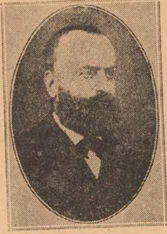
Ὁ Ἀλ. Κατακουζηνός, εἰς ἓκ τῶν ἰδρυτῶν — ἀναμνηστικῶν τῆς καλλιτεχνικῆς μᾶς ζωῆς, ὁ ὅποιος διηύθυνε τὸ Ὁδεῖον Ἀθηνῶν κατὰ τὴν πρώτην του περιόδον.

λίον ἐξελέγη ὁ Μ. Ρενιέρης, ἀντιπρόεδρος αἱ Ν. Μανρωκορθάτος καὶ Α. Μπαλάνος καὶ τὰ λοιπὰ μέλη οἱ Ν. Χατζόπουλος ταμίας, ὁ Γ. Παπαδόπουλος Γραμματεὺς, πρόεδρος τοῦ μουσικοῦ τμήματος ὁ Γ. Φιλήμων καὶ τοῦ δραματικοῦ τμήματος πρόεδρος ὁ Χαρ. Τριζούτης.