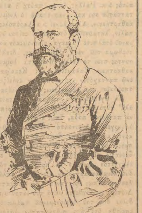
Ὁ πινυγίς Ἄγγλος ναύαρχος διὰ ΓΕΩΡΓΙΟΣ Ι' ΒΑΣΙΛΕΥΣ

εἶνε ἀπαράτητοι, ὅπως συμβαδίζη μετὰ τῶν ἄλλων Ἑβρωταίων λαῶν ἐν τῷ στήθει τοῦ πολιτισμοῦ καὶ τῆς προόδου, καὶ ὅτι, ἐάν ὑπάρχῃ τι χρῆζον περιστολῆς καὶ περιορισμοῦ ἐντὸς ὄρων καθωρισμένων, δὲν εἶνε τὸ κοινοβουλευτικὸν σύστημα, τὸ ὅστον ἀπεδείχθη πάντοτε εὐεργετικώτατον, ἀλλ' εἶνε αὐτὰ κεχωρηγμένα τῷ Στέμματι προνομία, ὡς ἡ ἀνεξέλεγκτος χρῆσις δὲν ὑπῆρξε πάντοτε ἐπιφελοῦς εἰς τὴν χώραν.